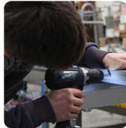
Produzione interna di persiane e scuri in alluminio